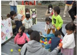
館庭で運動会をしました！