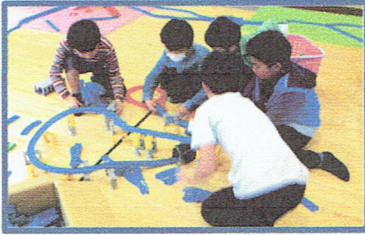
みんなの笑顔が溢れる一日でした。