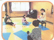
お母さんも息抜きに来てね

ガマ君、さらさら5匹のお友達がゲストに来てくれました。へび君とガマ君のコント(お話)は、笑いあり涙あり♪ママ達からは、クスクスと笑い声も...。ドリミの歌に合わせたダンスは、ちびっこやママ達も手拍子で参加してくれました♪一緒に遊んでいるうちに、はじめはへび君とガマ君を怖がっていた子も、だんだんとニコニコに♪ガマ君に手をパックと食べられるのを楽しむちびっこもできました。♪みんなの笑顔で、ほっこりとした雰囲気のみちちひろばとなりました♪ へび君&ガマ君、また遊びに来るといいね！