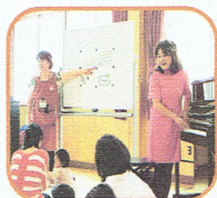
なかなかに楽しいですよ...お母さん達もコワイ...

先生のピアノと歌に合わせて、子ども達がお返事する姿はともかわいかったです。今回もたくさん動いたけれど、お母さんやお父さんはさわやかな笑顔！体を動かすって気持ちが良いですね☆