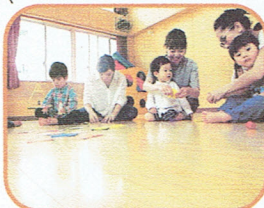
新しい遊びを体験して

「ぴよぴよひろば」では、親子で楽しむ体現遊びをしています♪小さな身体を一生懸命に動かしている二才児の姿には、なんとも言えない可愛らしさがあります。お母さんとお父さんも、お子さんと一緒に目線を合わせて、普段とは違う特別な時間を味わっています★ いままで参加したことのない親子さん、ぜひ遊びに来てくださいね！