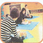
気軽に参加してみてね。

毎回、可愛くて仕方がない0歳児さんが集まる「ちびっこひろば」。2ヶ月のお子さんから来てくれています。親子遊びやわらべ歌、絵本の読み聞かせが中心であったり、生会もしていますよ。ささやかですがプレゼントも可愛い表情を見せてくれる子ども達と一緒に、初めましてのママ達も自然に会話が弾んでいます。