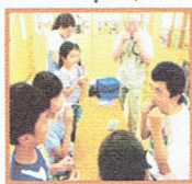
「すーいー！できたー！」

7月5日の草笛の会は、たくさんの子で盛り上がりました。簡単に見えて、なかなか音が出ない。昔遊んでいたなあ職員もチャレンジ。ん？鳴らない。そんな中、ボランティアのおにいさんはあつという間に「じゅー」と。これには子ども達も草笛愛好会のみなさんもびっくり。頑張る子どもたちは一人、二人と音が鳴り始め、マスターした子は嬉しそうに草笛を楽しんでいました。