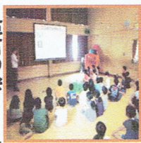
いつも通る道、どこが危険？

7月3日、児童クラブの子ども達が交通安全教室に参加しました。今回の先生は、赤岡自動車学校の皆さん。児童館から道路に出るときは？小学校から児童館に行くときは？実際の道の動画を見て、子ども達はグループ毎に危ない状況を話し合っていました。意見がたくさん！交通ルールってどんなこと？から自転車が走れる道まで、とても分かりやすく、楽しい雰囲気の中で教えて頂きました。ありがとうございました。