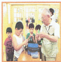
「ここを持って...」「こー？」