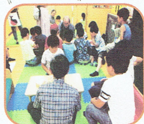
大人気!! 目指せ龍王!!