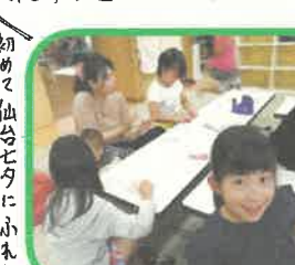
初めて仙台七夕にふれた人も、いい経験をしました！