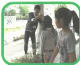
みじりの笹竹を切り...

七月七日、乳幼児親子さんや小学生の子ども達と一緒に、仙台七夕の七つ飾りの中から紙衣・吹き流し・鶴にチャレンジしました☆きれいな和紙に目が輝くみんな。そあとでお世話になってる坪沼神社から頂いた笹竹はいい匂い♪難しい所もあったけど、丁寧に作った飾りを笹に飾り、みんな嬉しそうに持って帰りました。