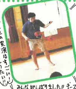
みんな観入りました！チズ！！

五月から約二ヶ月の練習期間を経て、七月二日に発表会を行いました。結城先生の指導日以外にも子どもたちは遊戯室で熱心に練習し、当日はとても緊張していました。人前で発表する、という大きな壁を乗り越えた子ども達は、発表後は満足したいい顔をしていました。