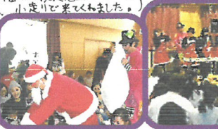
なんと、かみさんの正体は… 榎川の校長先生でした!! 小ぶりな来てくれました。

子育て支援クラブ「ガーネット」は、バリバリ子育て中のママ達が和気あいあいと楽しく活動しています♡ママ友づくりもたくさんできますよ。興味のある方は児童館までどうぞ!