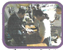
出刃包丁を手に、魚の解体ショー!!

今回は新田児童館に遊びに行き、新田地区のお父さん達と一緒に、芋掘りと芋煮会をしました☆天候にも恵まれ、大きなさつま芋を収穫し、あったか芋煮を囲みました!途中でお父さんによる魚さばきショーをサプライズで鑑賞!新鮮なお刺身も頂きました。あくおいしかった♡