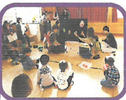
ハンドベル。本番。とても素晴らしい!