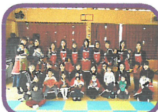
練習風景。子どもたちが見守り村。

子育て支援クラブガーネットさんによるハンドベル演奏とブラックライトパネルシアター、素敵でしたね♪ママ達がコツコツ準備と練習を重ねたオーブニングの後は、ボンクラーズショー☆子どもも大人も盛り上がり、そこへサンタクロースが登場☆お母さんへのプレゼントは、ガーネットさんからの心和むメッセージカード入りでした。「メリークリスマス!」の掛け声に紙吹雪を撒いたのも素敵でした。終了後、紙吹雪をあっという間に片付けるお母さん達の手際の良さは流石!その姿を見ておかたづけをする子ども達も可愛かったです。