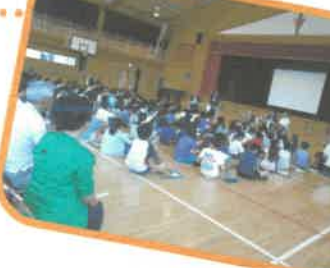
よめは知らないな... たった！