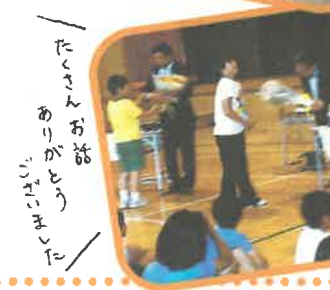
たくさんお話ありがとうございました。