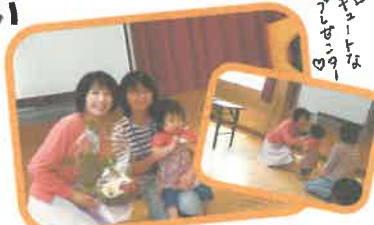
キッズは... プレゼン...