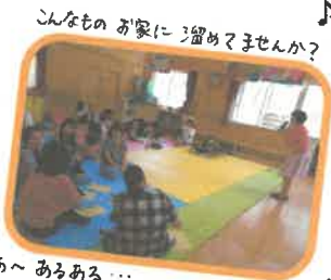
みんなの お家 に 溜め ません か？