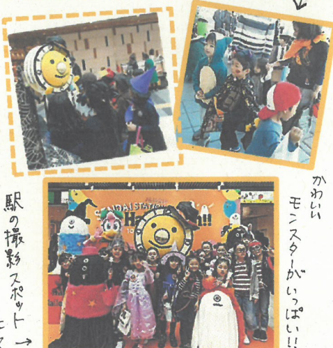
駅の撮影スポットにて

九月と十月に、明治青年大学の皆さんによる『わいわい明青塾』が開かれました。遊戯室でけん玉や折り紙、将棋やブンゴマと一緒に楽しく遊びました。九月には手品、十月には落語の高座もあり、生の語りに子どもたちは大盛り上がり! 笑顔があちこちで見られた日になりました。