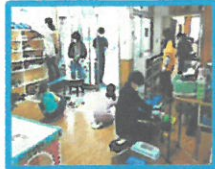
普段はなかなか手のまわらないところまで...ありがとうございます!!

「いつも使っている児童館ありがとう！」 ということで、児童クラブ児童とその家族の皆さんが大掃除をしてくださいました。 参加者多数！グループ毎に分担し、窓のフチから柱・梁・細かいところまで児童館ゼーんぶをピカピカにしてくださいました☆ いつもよりキレイ？になった児童館に来て、たくさん遊んでくださいね!!掃除をしてくださった皆さん、本当にありがとうございました。