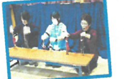
サンタさんに、ちびっこサンタ