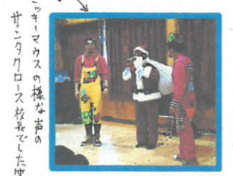
ミッキーマウスの様な声のサンタクロース校長でした!