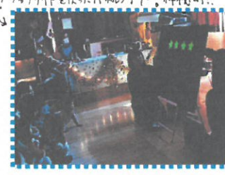
ブラックライトも使ったパネルシアター、神秘的!!