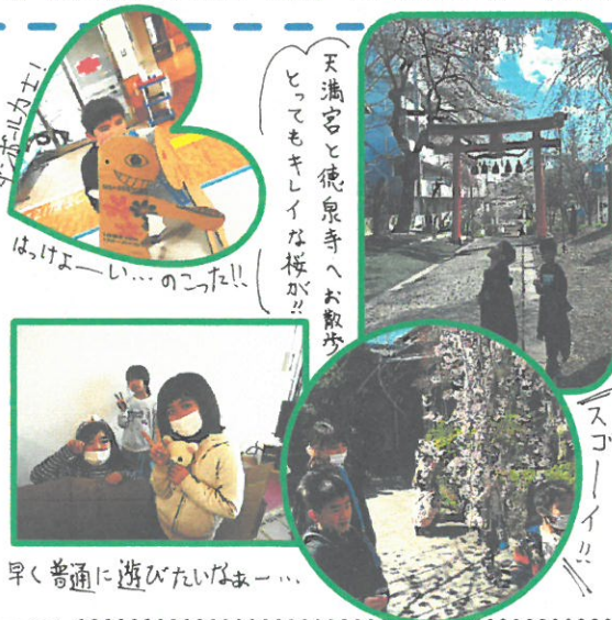
早く普通に遊びたいなまー...