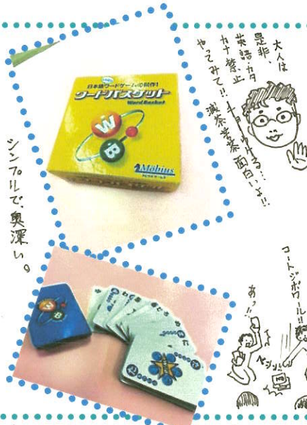
シンプルで奥深い。

どうしても大人と子どもの実力差がついてしまう、という時はハンデをつけてみましょう。大人は4文字以上の単語のみ、一定時間たつまでは出さない、など。筆者（職員わんわん）のおすすめは「英語、カタカナ語禁止」のハンディキヤップ…手加減です。思わぬところでまね…失敗してしまう、抱腹絶倒のゲーム…遊びと化しますよー！