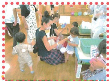
まるで夏祭り！ ママたちも楽し ましたよ。