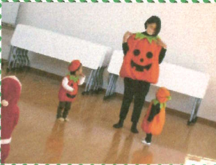
お母さんも仮装ありがとう!!

ご協力いただいたアンパンマンミュージアム&地域商店の皆様、温かく出迎えていただき大変ありがとうございました。そしてママたちもゴールまではずっと完歩し、お疲れ様でした。