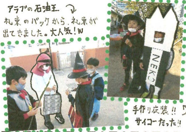
アラフの石油王 ね東のバックからね東が出てきました。大人気!!