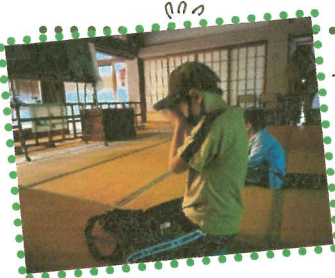
ドキドキナムナム...

さて、この後がメインイベント。徳泉寺に伺い、墓地で「肝試し」を行うのです。薄明りの本堂でドキドキしながら自分の順番をじっと待つ子ども達。中には仏様に向かって、ずっと手を合わせている子もいました。それもそのはず。肝試しは、たった一人で行かなければならないのです。「得体のしれない恐怖」と向き合い、見事にゴールした子ども達は、達成感と自信に満ちた表情を見せていました。子ども達のかつて凄いですね！