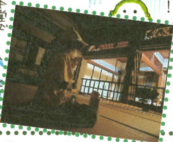
本堂で順番まち、ちやっ...!