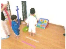
ストラックアウト! ちろちろわらって、ホーッ! 水系は、窓際で。 いいね! 駅東交流センター

いつもの児童館とは違う雰囲気を感じたサロンのいかがでしたでしょうか？ 暑い中、参加してくださった皆さん、民生委員・児童委員の皆さん、ありがとうございました