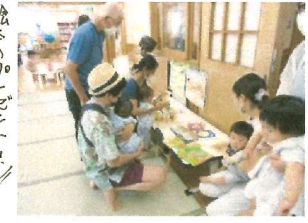
絵本のプレゼント!! ありがとうございます!!