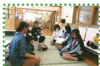
←中学生による読み聞かせの様子