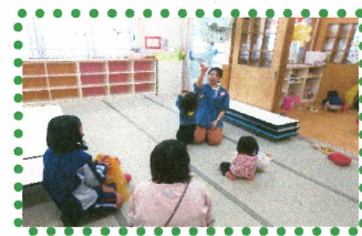
みんなががががが